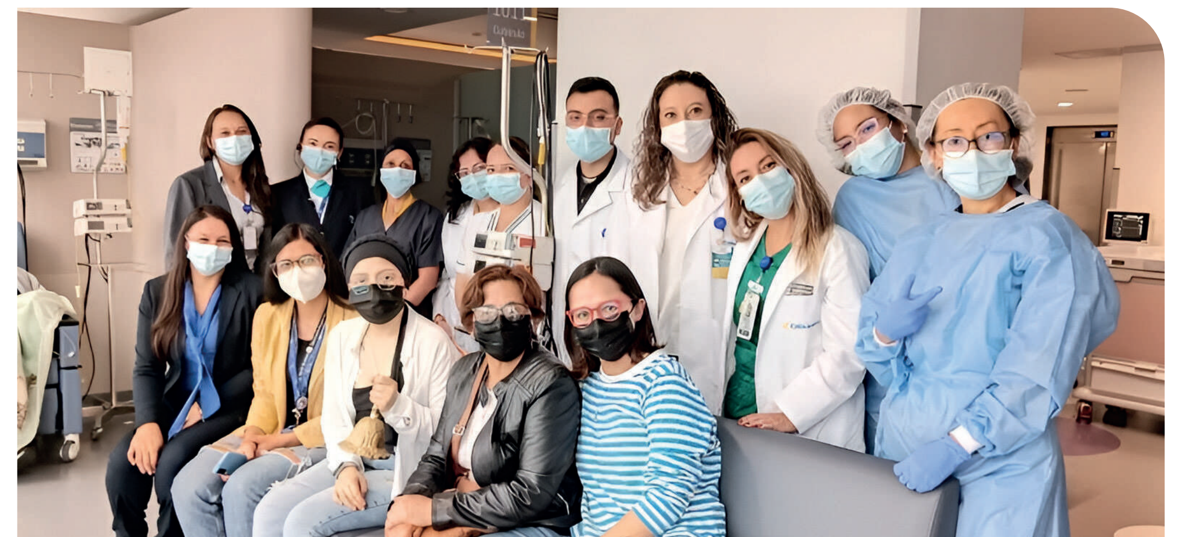
Campanazos por la vida